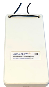
AURA-FLOW +QN Maße (mm): 115 x 60 x 14 Gewicht: ca. 105 g

Bisherige Tests zeigten spürbare positive Effekte. Je nach persönlicher Ausgangssituation und aktueller Befindlichkeit wird AURA-FLOW +QN als allgemein wohltuend, Wärme ausstrahlend, Energie aufbauend oder Schmerz reduzierend wahrgenommen. Weiterführende Informationen zur grundsätzlichen Funktionsweise der PHI energetics Harmonisierung sind dem "Technologie" - Flyer zu entnehmen, siehe Homepage unter www.phi-energetics.de/technologie.html